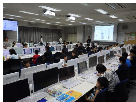
昨年度のプログラミング教室の様子